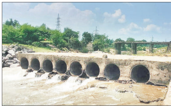
बारिश से क्षतिग्रस्त हुई पुलिया।