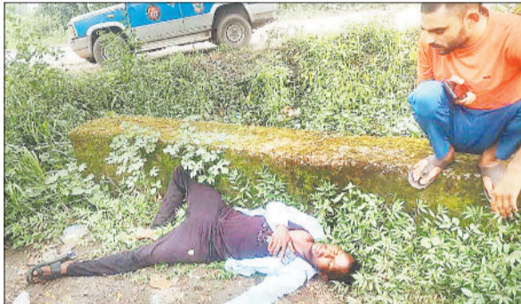
घटनास्थल में पड़ा घायल युवक।