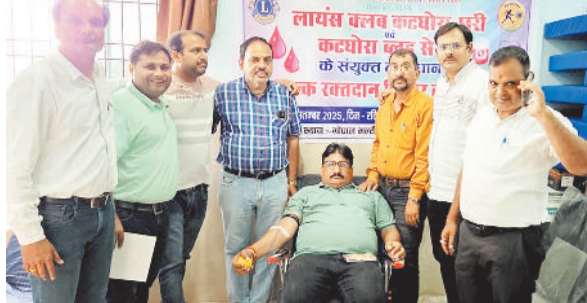
रक्तदान करते लायंस क्लब के सदस्य।