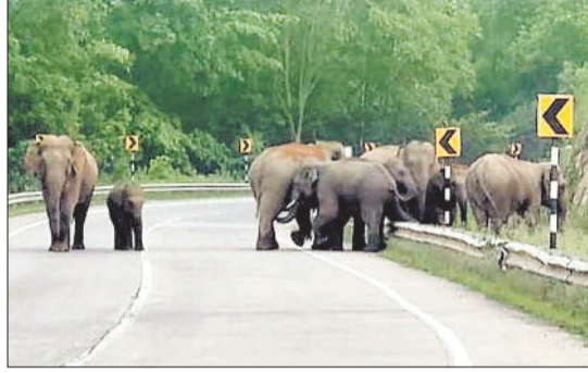
विचरण करता हाथियों का झुण्ड।

कटघोरा वनमंडल में हाथियों ने अपना स्थाई ठिकाना बना लिया है और यही वजह है कि वनांचल क्षेत्र में बसने वाले ग्रामीण और हाथी के बीच लगातार द्वंद बढ़ता ही जा रहा है। इसे रोक पाना वन विभाग के लिए चुनौती बना हुआ है। वन विभाग को रोकने के लिए और ट्रैकिंग सही से हो सके इसके लिए ऑटोमैटिक ट्रैप कैमरा लगाने की तैयारी कर रहा है ताकि ऑटोमैटिक कैमरे के माध्यम से हाथियों की पल-पल की सूचना ग्रामीणों और वन विभाग के अधिकारियों तक पहुंच सके ताकि उसकी निगरानी पूरी हो हो सके।