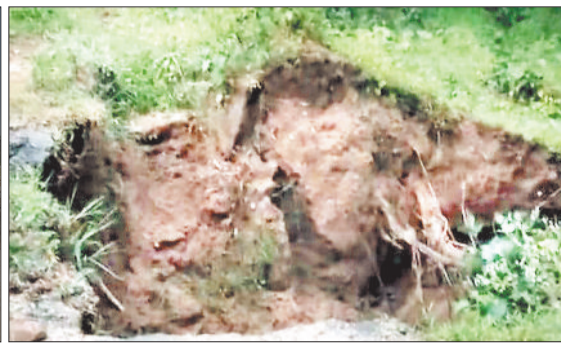
जटगा मुख्य मार्ग का धंसा हुआ हिस्सा।

हरिभूमि न्यूज ►► कोरबा इस वर्ष हुई भारी बारिश से सर्वाधिक नुकसान ग्रामीण अंचलों के लोक निर्माण विभाग के द्वारा बनाई गई मुख्य सड़क और ग्रामीण क्षेत्रों में पीएम ग्राम सड़क योजना अंतर्गत निर्मित